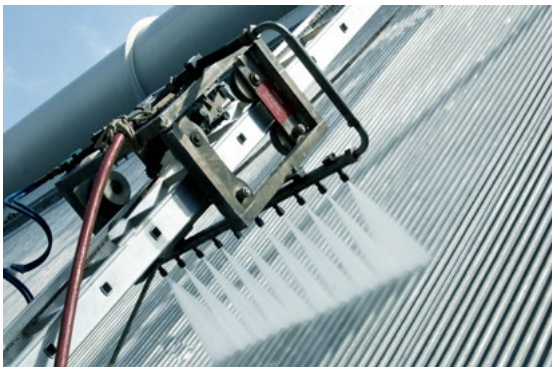
Klassische manuelle Wasserhöchstdruckreinigung oder der Einsatz von automatisierten Systemen – das Ergebnis wird Sie überzeugen