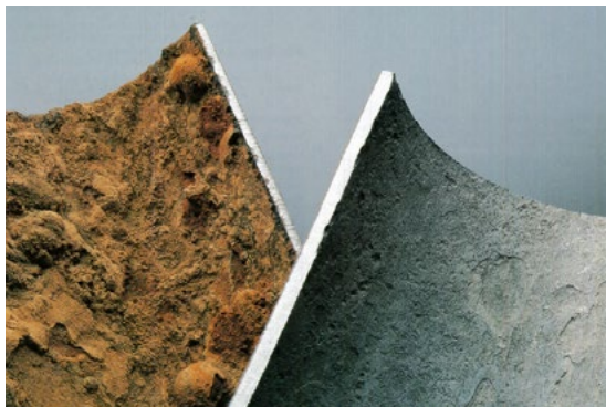
Optimales Reinigungsergebnis: links ein verschmutztes Rohrstück mit Belägen, rechts das Objekt nach unserer chemischen Reinigung mit anschließender Passivierung